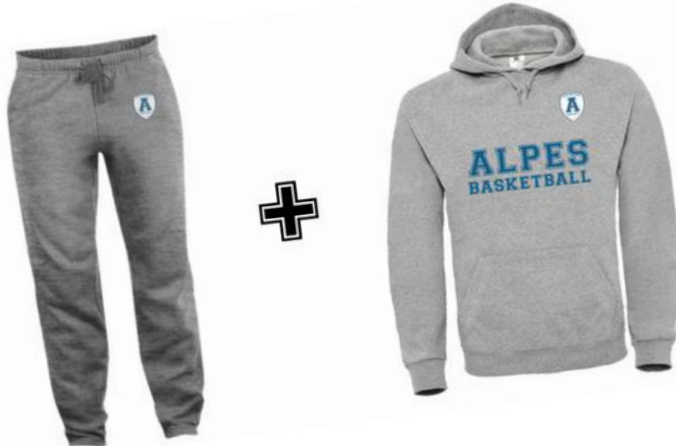
Le pack Survêtement