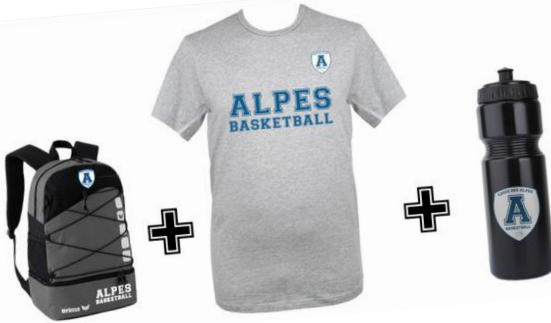
Le pack Tee-Shirt, Sac et Gourde